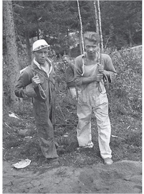
Talkoolaisia raivaamassa omakotitalon pohjaa Raitämäentellä 1936.

Itse kaivetut kaivot olivat tavallista arkipäivää, samoin tunkiot ja puuceet tonttien perällä sekä laskeämpärien käyttö. Ei niitä edes ihmetelty, kuten ei myöskään lähes