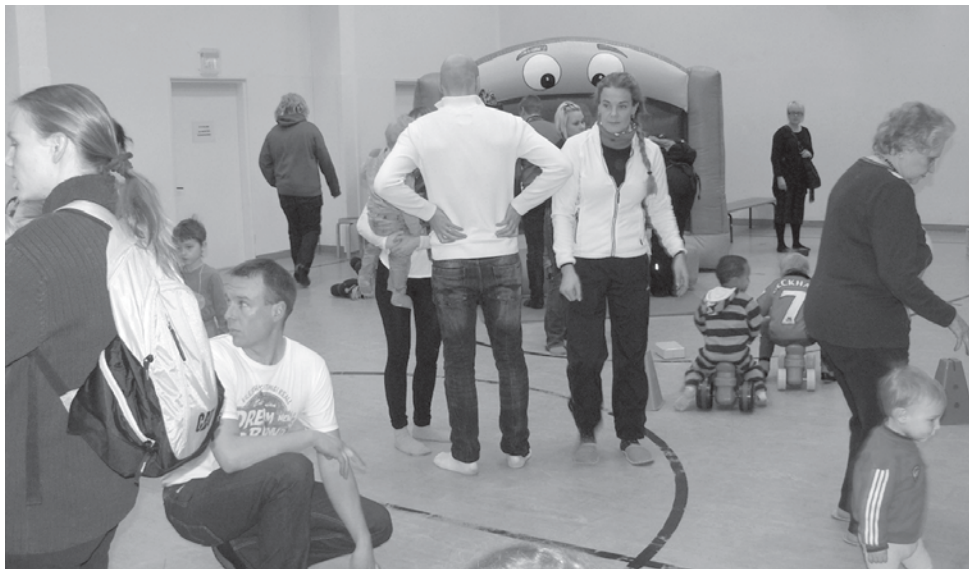
Laskiaisrieha keräsi Vartiokylän kirkon jumppasaliin kaikenikäisiä leikkijöitä.