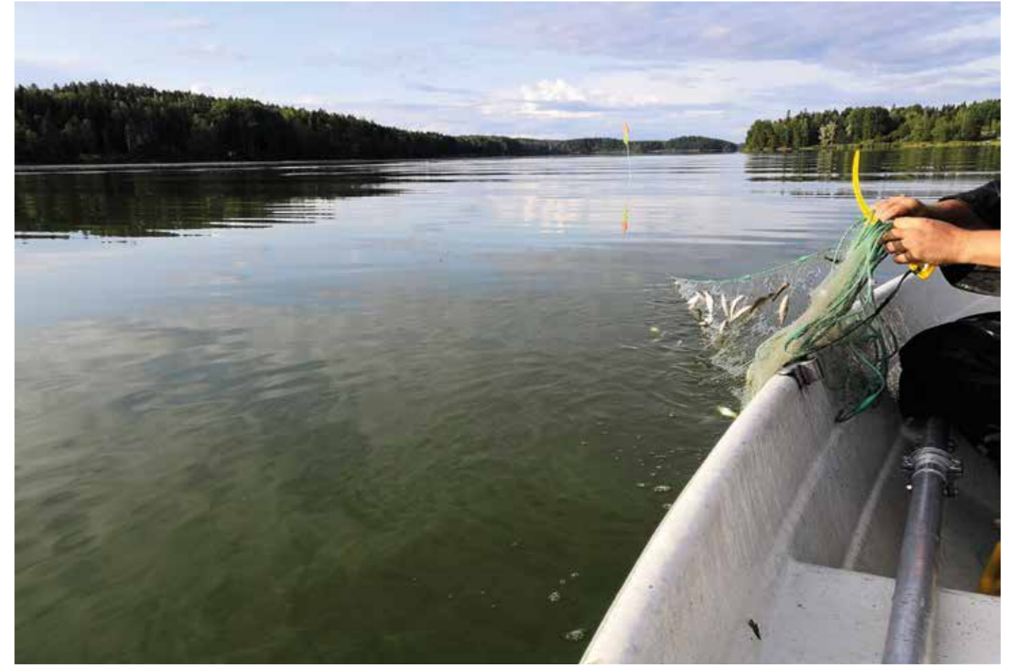
Järvien kunnostussuunnitelmassa tutkitaan vedenlaadun lisäksi biologisia tekijöitä. Kaikkien latvajärvien kalasto oli koeverkkoalastuksen perusteella särkivaltainen.

Siuntionjoen latvajärvien kunnostussuunnitelmat ovat herättäneet ilmestyttyään valtavasti kiinnostusta ja paikallisten halun ryhtyä kunnostussuunnitelmissa esitettyihin toimenpiteisiin. Enäjärven ja Poikkipuolalaisen kunnostus vaatii arviolta noin 6,5 miljoonaa euroa seuraavien yhdeksän vuoden aikana. Ylirehevä Enäjärvi tarvitsee järeitä toimia: kolme vuotta tehokalastusta rysin, nuotalla, kiskoin ja ojapyyntein ja maltillisen kemikaalikäsittelyn järven tilaa hallitsevan sisäisen kuormituksen vähentämiseksi sekä mm. kosteikkojen ja laskeutusaltaiden kunnostuksen ulkoisen kuormituksen vähentämiseksi. Poikkipuolalaisen kannalta tärkeintä on vähentää järveen päätyvää ulkoista ravinnekuormitusta, josta yli puolet tulee Enäjärvestä. Latvajärvien kunnostuksen rahoituksen hankintaan on perustettu paikallisten aktiivien ja Latvajärvien suojeluyhdistyksen toimesta erillinen rahoitusnyrkki, jonka avulla on kerätty resursseja Siuntionjoen latvavesien kunnostamiseen. Vihdin kunta, Lasy ry, Prysmian Group Finland Oy ja Yara Suomi Oy ovat lähteneet vahvasti mukaan tähän hankkeeseen. Yhteisellä panostuksella latvajärvien kunnostus on