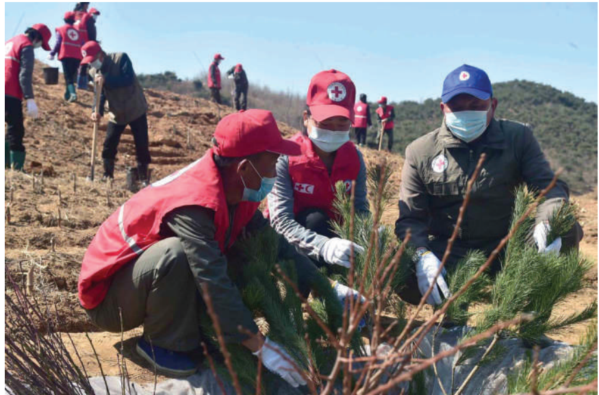
Kevään 2020 puunistutuskoot.