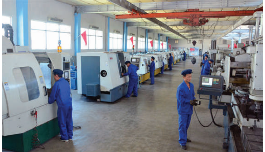
Ragwon Machine Complex on yksi teollisuuslaitoksista, joka on päässyt nauttimaan teknologisesta kehityksestä.

Maa kehittää parhaillaan mm. juuri työpaikkojen koulutustiloissa erityyppisiä uusia innovaatioita tuotantolaitoksilleen, sillä siirtymällä IT-pohjaisiin ratkaisuihin saadaan parempia tuloksia tuotannossa. Myös erilaisia teknologisia keinoja koronaviruksen torjunnassa tutkitaan.