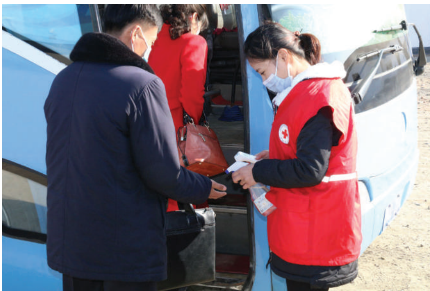
Käsien desinfiointia ja lämmön mittausta koronan vastaisessa taistelussa.

ton vapaaehtoiset WASH-tiimistä (water, sanitation and hygiene) huolehtivat myös kuudesta liikuttavasta vedenpuhdistuslaitoksesta, joita voidaan siirtää tarvittaessa tuhoutuneille alueille.