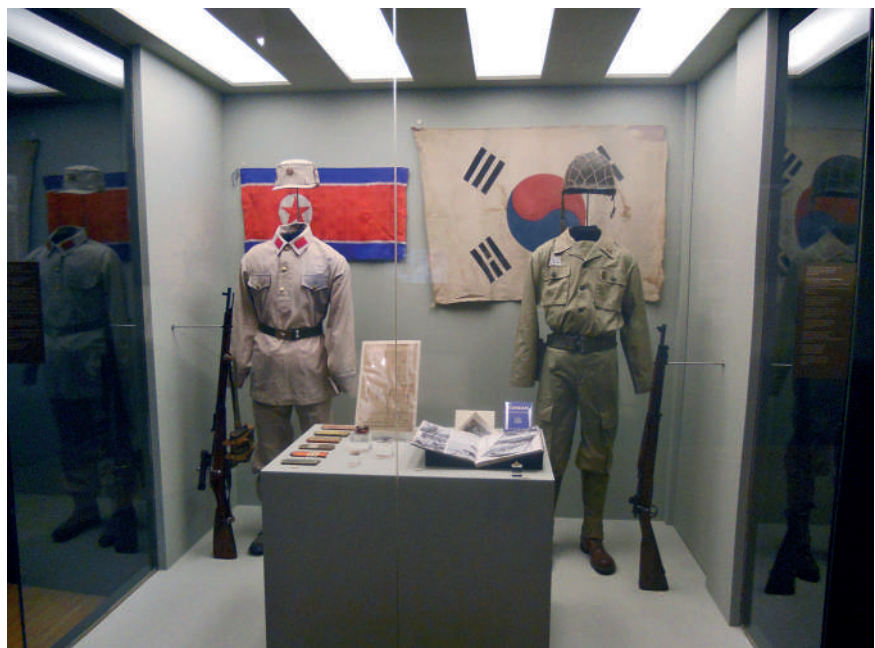
Korean sota jakoi niemimaan kahtia ja aiheutti pysyviä muutoksia maailman poliittisella kentällä.

Niemimaan jakautumisen seuraukset olivat merkittäviä, ja ne ovat olemassa edelleen. USA:n sotilashallitus pyyhkäisi syrjään Korean kansantasavallan – ”kommunistien, anarkistien, ammattiyhdistysaktivistien, kristillissosialistien ja sosiaalidemokraattien moninaisen joukon” – joka oli julistettu Soulissa syyskuussa 1945