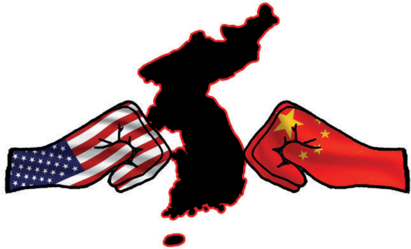
Korean niemimaa on suurvaltataistelun pelinappulana.

Näin ollen sota fasismia vastaan muuttui kylmäksi sodaksi. Yhdysvaltain imperialismi, jota ensimmäisen maailmansodan jälkeinen eristäytyminen jossain määrin hillitsi, nousi täyteen kukkaan.