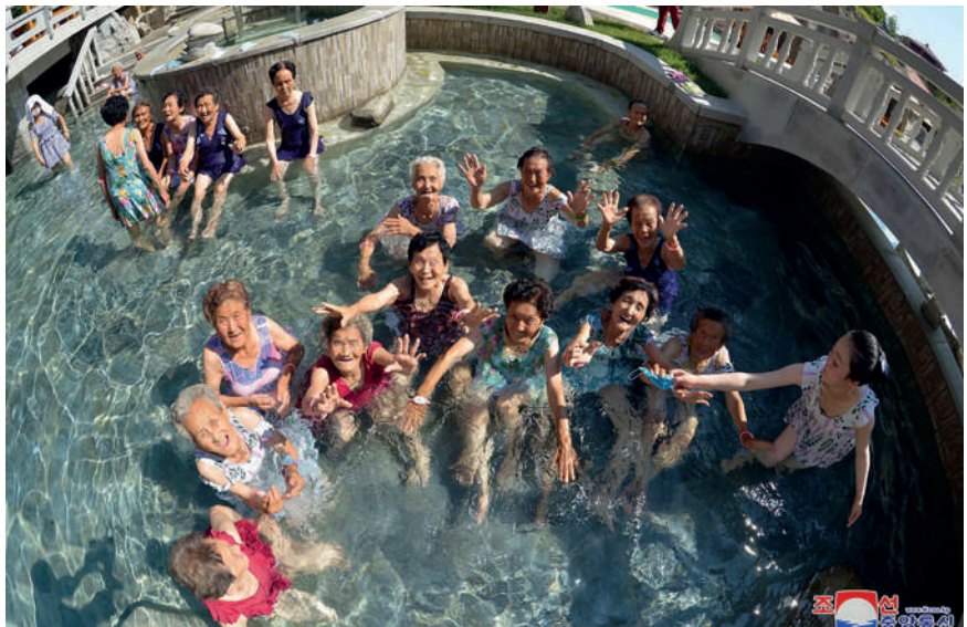
Sotaveteraaneja Yangdokin kylpylässä.

Pohjois-Koreassa on yli 60 kuumaa lähdeä, joiden lämpötila on yli 50 astetta ja yli 50 mineraalilähdeä, joiden lämpötila jää noin 10 asteeseen. Kuumat lähteet ja mineraalivesivarannot sisältävät ihmisen terveydelle tärkeitä mine-