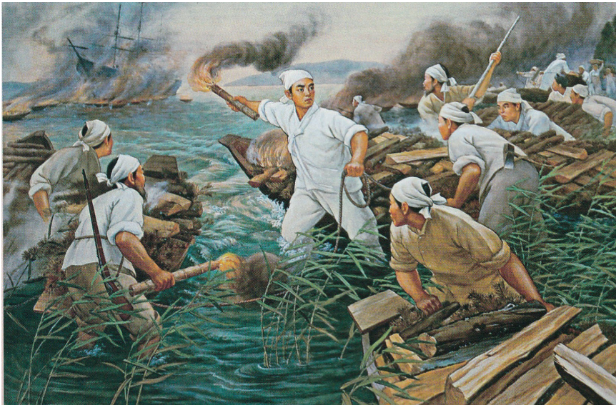
Korealaiset hyökkäävät amerikkalaista vakoilualuista Kenraali Shermania vastaan syyskuussa 1866.

Korean niemimaalla Venäjän, Kiinan ja Japanin intressit kohtaavat ja törmäävät. Se on strategisesti maailman arvokain paikka, josta imperialistit ovat olleet ahnaasti kiinnostuneita joko strategisen tukikohdan laajentamiseksi tai alueen hallinnan ryöstämiseksi kilpailevilta valloilta.