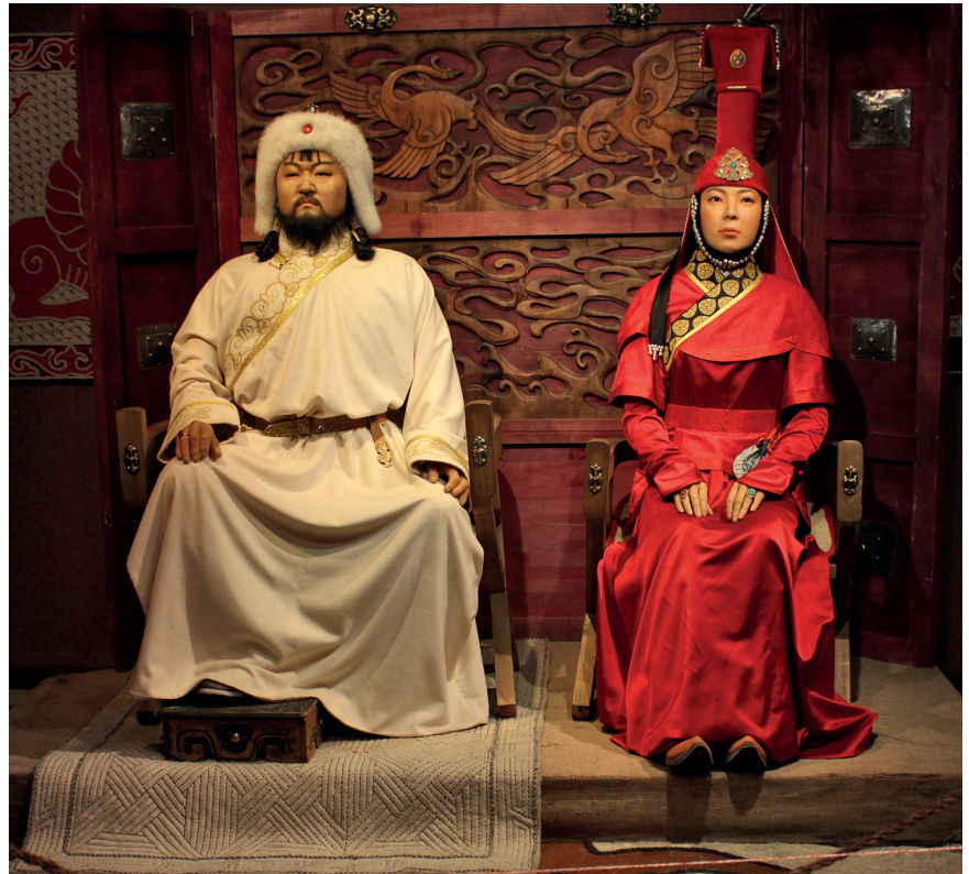
Mongolit loivat historian suurimman maaimperiumin.

Korean niemimaata on kuvailtu Japanin sydämeen osoittavana tikarina. Vaikkakin ilmaisu on peräisin 1800-luvulta, jolloin tikari osoitti toiseen suuntaan ja se oli itse asiassa tekosyy Japanin Korean valloittamiselle. Ilmaisu oli oikea 1300-luvulla. Koreassa valmistetut alukset, merimiehet ja sotilaat olivat tär-