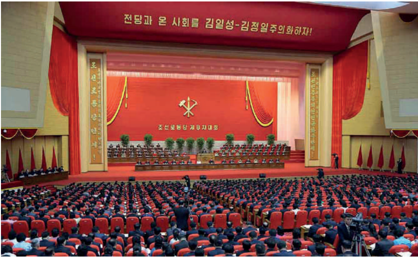
WPK:n 8. edustajakokous pidettiin tammikuussa 2021.

Korean työväenpuoleen 8. edustajakokous pidettiin 5. – 12. tammikuuta Pjongjangissa. Edellisessä kokouksessa vuonna 2016 päätettiin, että seuraava kokous järjestetään viiden vuoden kuluttua. Näin tapahtuikin koronatilanteesta huolimatta.