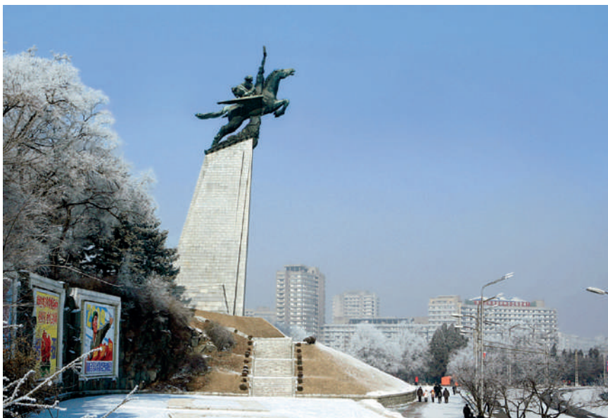
Pohjois-Korea herättää usein keskustelua mediassa, ja maassa käyneet ovat julkaisseet aiheesta monenlaisten mielipiteiden värittämiä kirjoja.