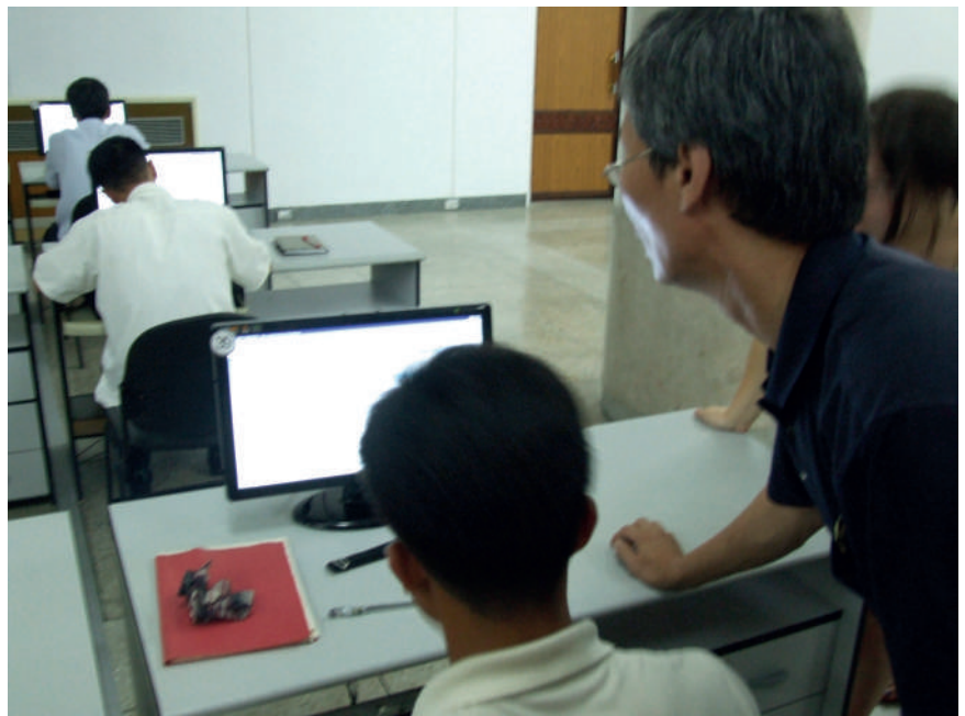
Opiskelua kirjastossa.

Näin tyydytetään työläisten kirjojen kysyntä.