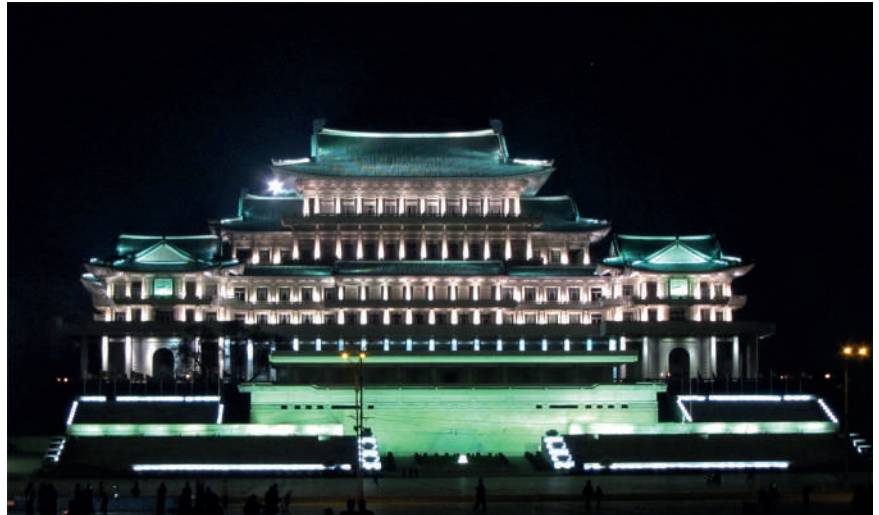
Suuri kansankirjasto.

Kirjastona ja informaatiopalvelun keskuksena tutkimustalo hoitaa kirjojen lainausta ja viestintää, kirjallisuuden hakupalvelua ja julkaisua sekä valokopiopalvelua.