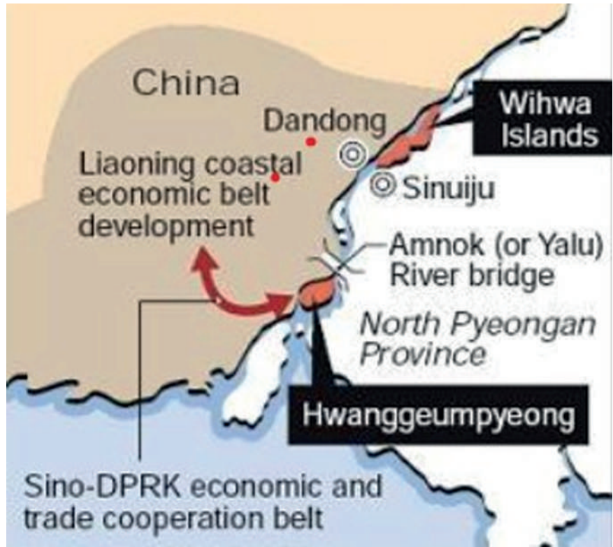
Hwanggumpyong-Wihwan erityistalousalue sijaitsee KDKT:n ja Kiinan rajalla.

Uuden vapaakauppa-alueen tarkoituksena oli parantaa Kiinan ja KDKT:n välistä infrastruktuuria (mm. siltojen rakentaminen ja kunnostaminen sekä rautatieyhteyden rakentaminen) ja mahdollistaa suuret kiinalaiset investoinnit KDKT:n kaivoksiin. Kaikki nämä on nivottu yhteen Kiinan koillisprovinssien kehittämissuunnitelman kanssa eikä tämän strategian toteuttaminen ollut kiinalaisten