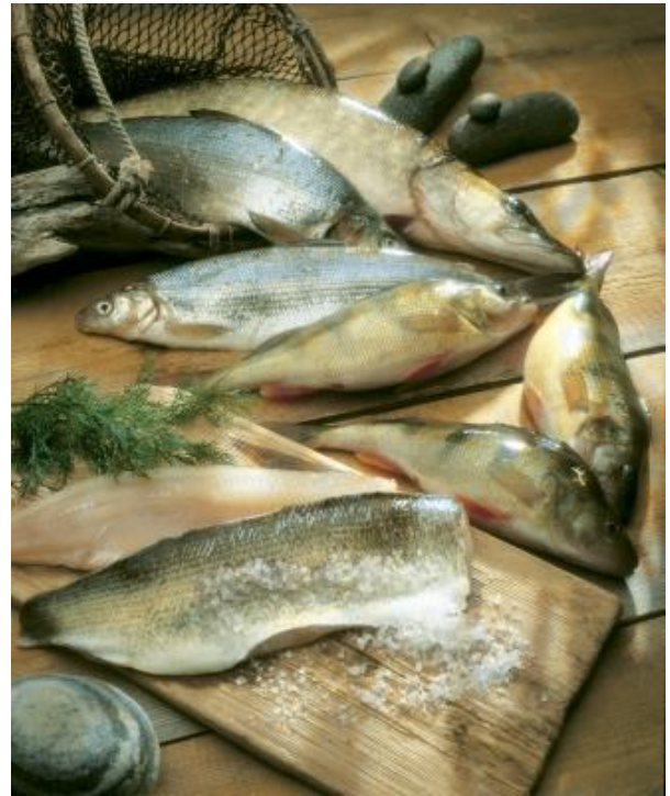
Kuva Pro kala