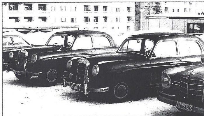
Ensimmäisen kokouksen osaanottajien Mersu-kalustoa Martinlaakson Kesoilin pihalla. 13.12.1978