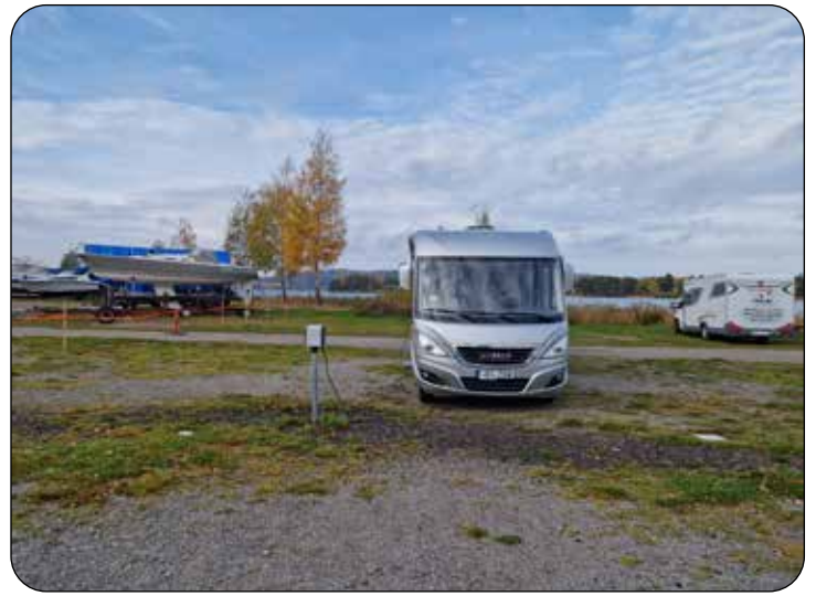
Ställplatsen i Karlsborg

På onsdag förmiddag packade vi ihop och tackade för oss. Bore åkte mot Göteborg och vi hamnade i ett regnigt Karlsborg, vädret tillät bara en promenad till en Pizzeria nära ställplatsen. Nu var det bara sista biten hem kvar så var denna höstresa till ända.