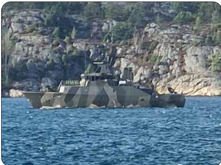
Club Solifer Nytt