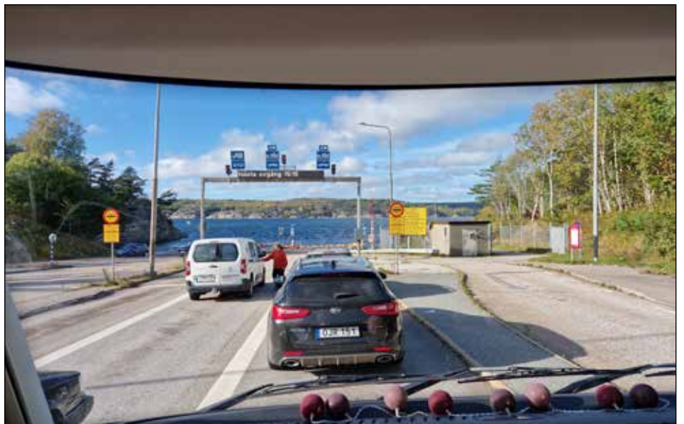
Väntan på färjan över Gullmarn

Besök på Karingön fanns med på agendan men väderprognosen såg inte bra ut, regn och blåst åt det hållet så vi planerade att besöka Fjällbacka på måndagen istället.