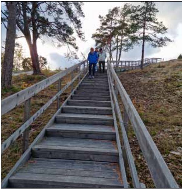
Många trappor vid Aspeberget