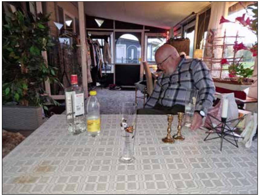
Groggtimme i förtältet