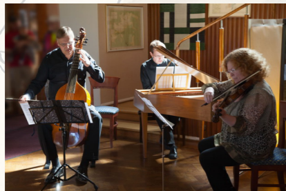
Kuvia vuosilta 2012-2014