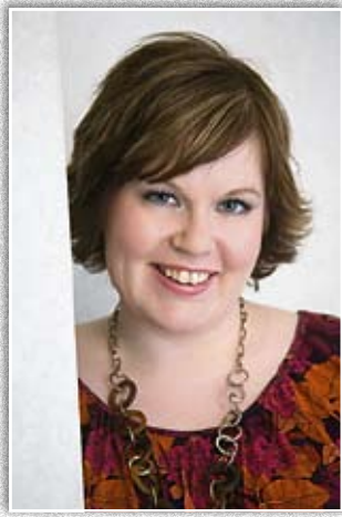
Annika Saarikko Keskusta 2. varapuheenjohtaja

Tuon kesän jälkeen olen tavannut Annen monesti erilaisissa keskustan yhteyksissä. Olen oppinut tuntemaan hänet määrätietoisen, rohkeana ja oikeudenmukaisena vaikuttajana. Hän on eteläpohjalainen vahva nainen, joka tietää mitä haluaa. Hänellä on palo yhteisten asioiden edistämiseen, lujaa otetta ja lämmin sydän. ●