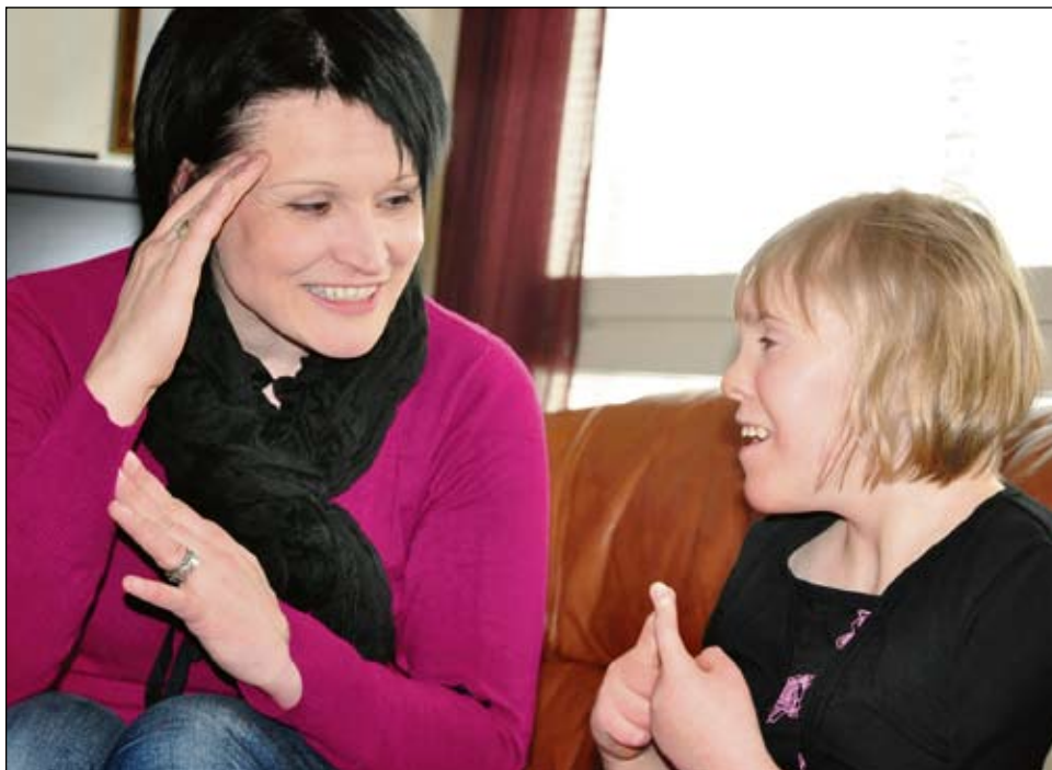
”Jos mökki olis pieni ja punainen, niin kodiksi tahtoisin juuri sen...”, lauletaan tässä tukiviittomin.