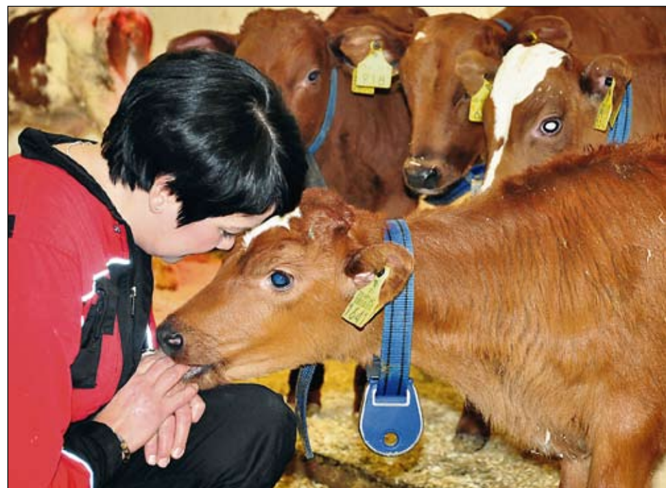
Vasikat luottavat hoitajaansa. Tunne on molemminpuolinen.