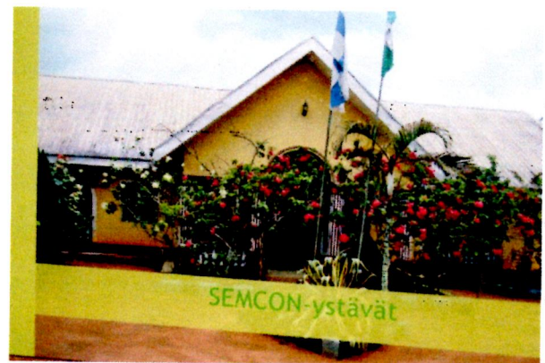
Pienen nigerilaiseen kylään saatiin pitkälti Tervojen ansiosta oma sairaala.