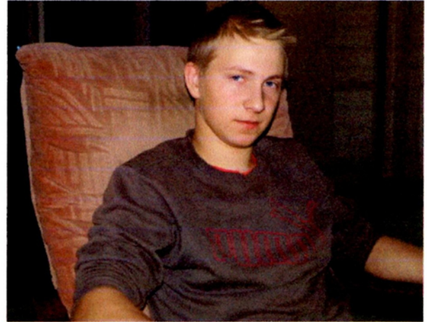
Vilillä on jämäkkä ote työhön.

”Minulla on tietokoneella oma viljelysuunnitelma, laskutusohjelma ja pienimuotoinen kirjanpito-ohjelma. Tukien saannin edellytyksenä on selkeä viljelysuunnitelma, joka täytyy myös tarvittaessa näyttää. Ruiskutushommissa täytyy olla ruiskutustutkinto ja ruiskut testattu, itselläni molemmat ovat kunnossa. Ensimmäisen vuoden kirjanpidon olen hoitanut itse, mutta tarkoitus on antaa se jatkossa ulkopuolisen ammattilaisen hoidettavaksi niin, että sekin homma on hyvässä järjestyksessä.”