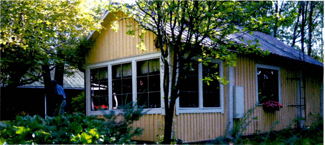
Mäkitupa, Avikaisten kaunis kesäasunto sijaitsee puiden siimeksessä Hevonpääntien alkupäässä.