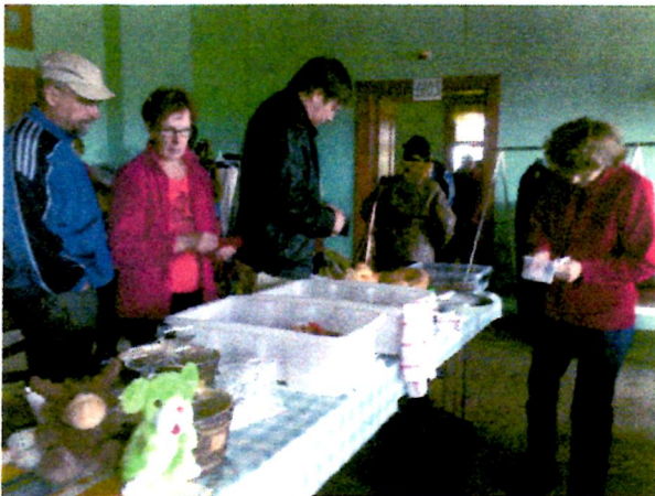
Leivonnaiset kävivät hyvin kaupaksi.