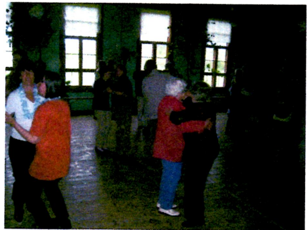
Vaikka miehitä olikin pulaa tansseissa, ei se kuitenkaan tahtia haitannut tansseissa.

Viime kesänä ensi kertaa vuosiin aloitetut seurantalonsanssit vedettiin tänä vuonna, 18.7. jo lähes rutiinilla. Aggregaatti takasi näyttämöllä tansseissa parastaan pisteille Hassakoivun pelimanneille soittotilat ja valot, ja samalla innokkaille tanssijoille jäi runsaasti lattiatilaa. Väkeä tansseissa oli noin 60, joista iso osa tuli kylämeidän ulkopuolelta. Tahtia ei haitannut, vaikka miehiä puuttui, tyttöpareilla menttiin niin kuin ennen vanhaan!