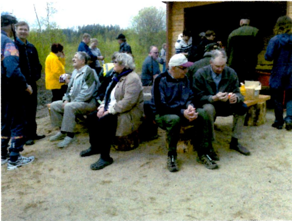
Laavulla seurusteltiin ja syötiin makkaraa.

Ylistystä luontokeskuksen aikaansaamisesta tuli myös Lahden lintuharrastajien edustajilta sekä Asikkalan luonnonystävilta, joiden kanssa tehty tiivis yhteistyö tuotti alueelle kauniit opastaulut.