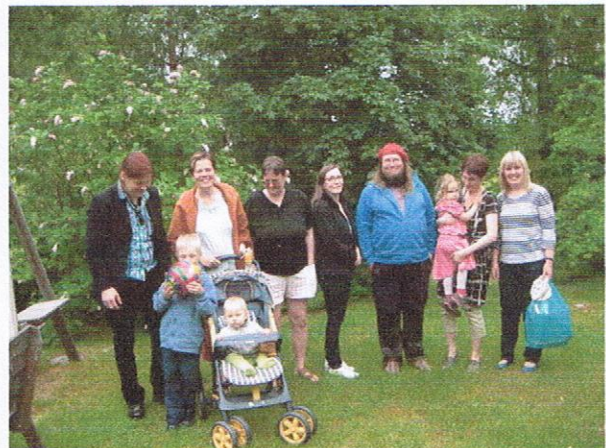
Päivien esiintyjä luonnon helmassa