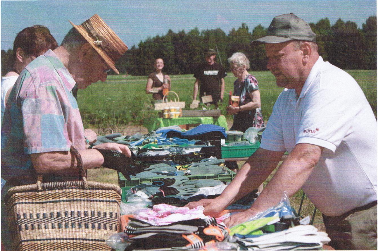
Kauppa käy, kun rukkaskauppias saapuu paikalle.