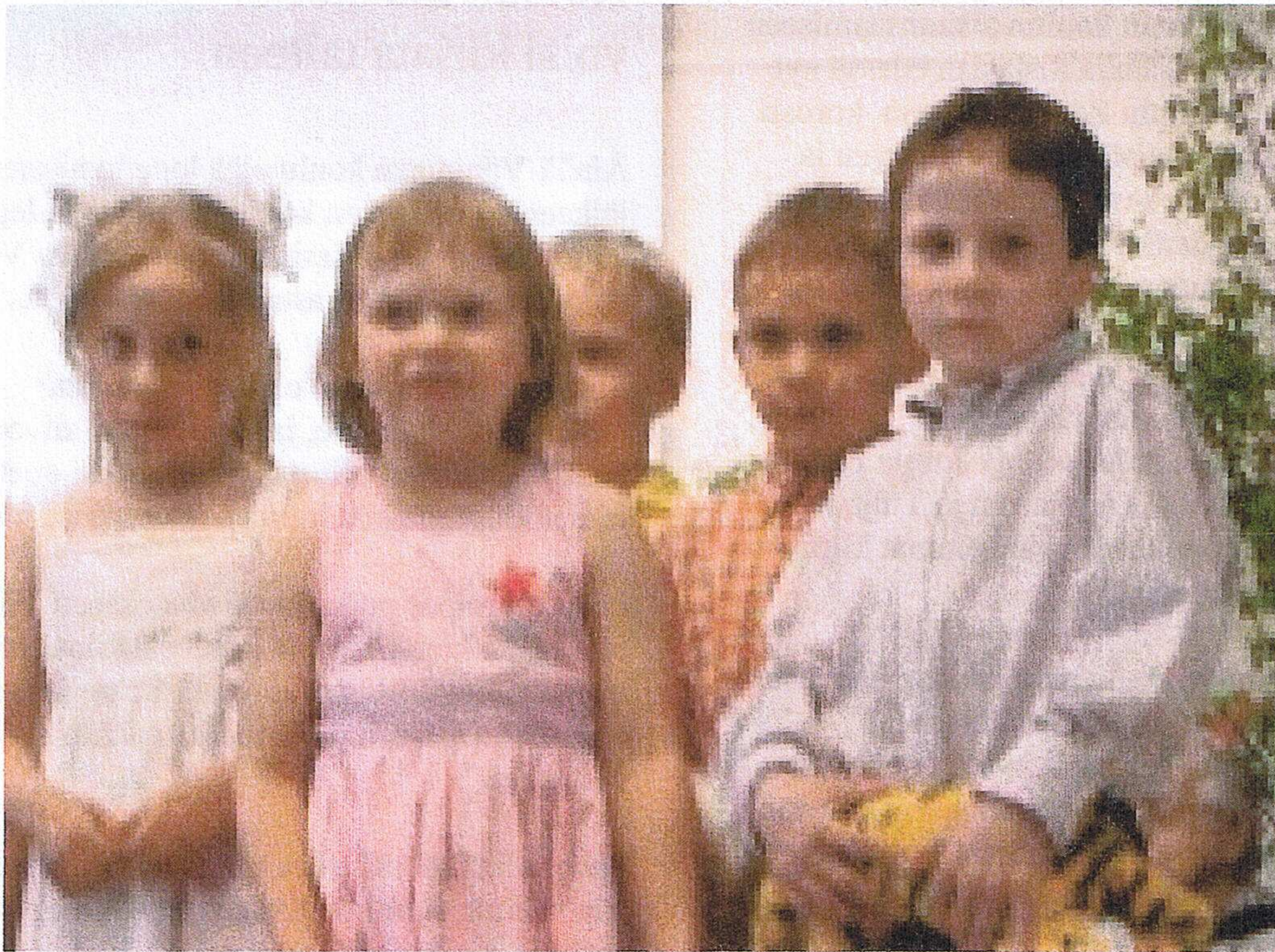
Reippaat eskarilaisetkin esiintyivät koulun kevätjuhlassa.