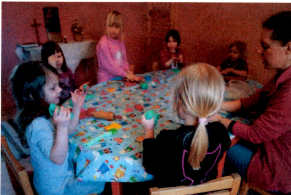
Lapset Mielosen Annen johdolla askartelupuuhissa.