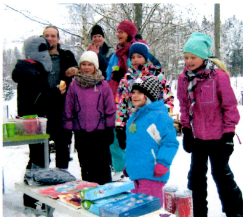
Hiihtokilpailujen iloisia voittajia.