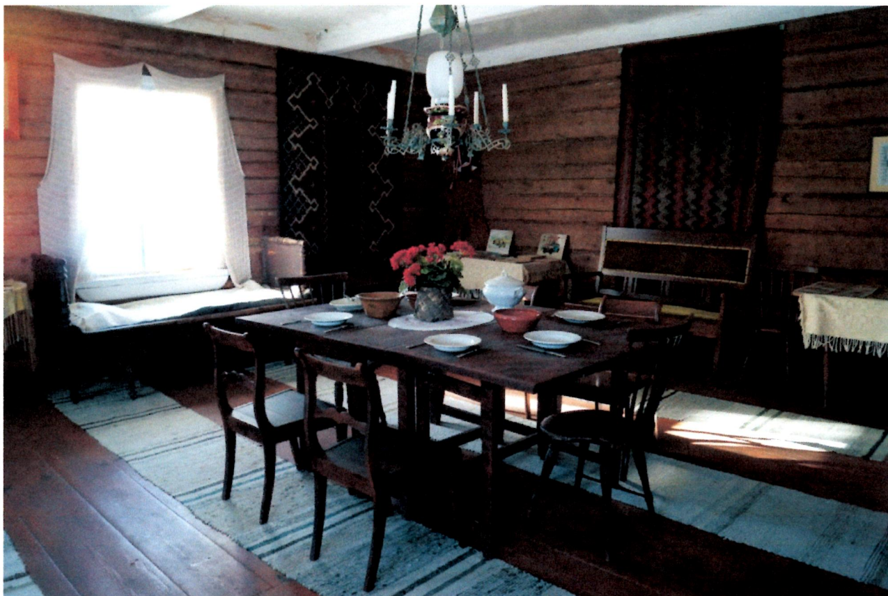
Tupalan päärakennuksen sali antaa edustavan kuvan vanhan maalaistalon juhlahuoneesta.