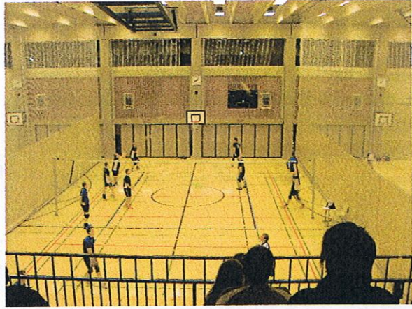
Kuvassa finaalijoukkueet lämmittelemässä ennen ottelun alkua. Äijät takakentällä.

11.3. pelattu ottelu oli ajoittain täysin Äijien ylivoimaa, mutta viimeisessä erässä haastaja Sählärit vänsi joukkueensa sitkeästi mukaan mestaruustaistoon ja vei voiton pienimmällä mahdollisella erolla. Se olikin Äijien ainoa häviö koko kauden otteluissa. Mestaruuden uusiminen oli kutkuttavan lähellä, mutta ei se hopeakaan häpeä ole!