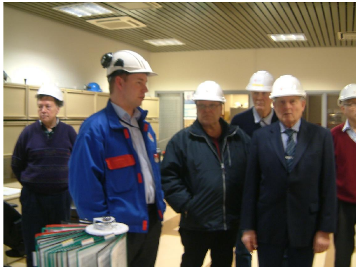
Kuva vierailusta Energialaitoksella