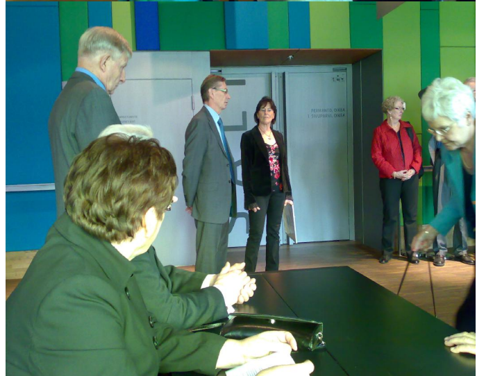
Kuvia Hämeenlinnan kaupungin vastaanottotilaisuudesta

Musikaalin jälkeen siirryimme ravitsemaan myös fyysistä puolta. Ravintola Iso Huvila oli kattanut meille herkullisen päivällisen.