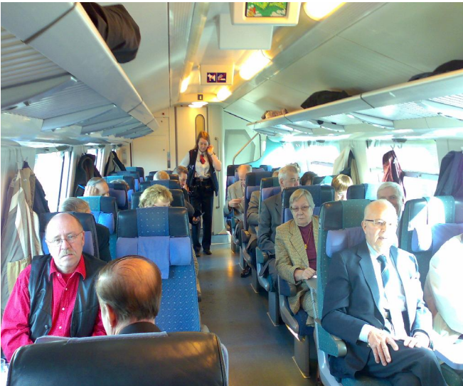
Kuvassa olemme matkalla Hämeenlinnaan

Varapuheenjohtaja oli tehnyt matkaeväät. Lapsuuden junamatkoja muistellen eväät olivat matkan tärkein anti. Ne oli kaivettava esille heti kohta Pasilan jälkeen – niin nytkin. Eväitä syöden matka meni rattaisti.