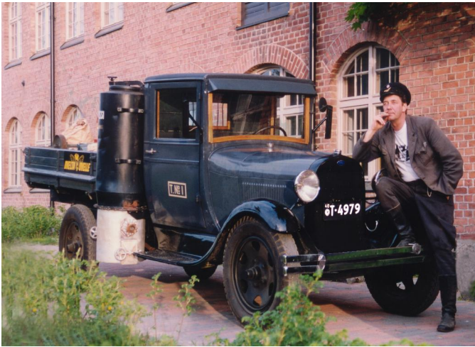
Entisöity Ykkösen "edustustehtävissä" 1990 luvulla, kuljettajana kirjoittaja.