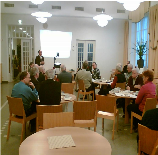
Kuva vuosikokouksesta 2008