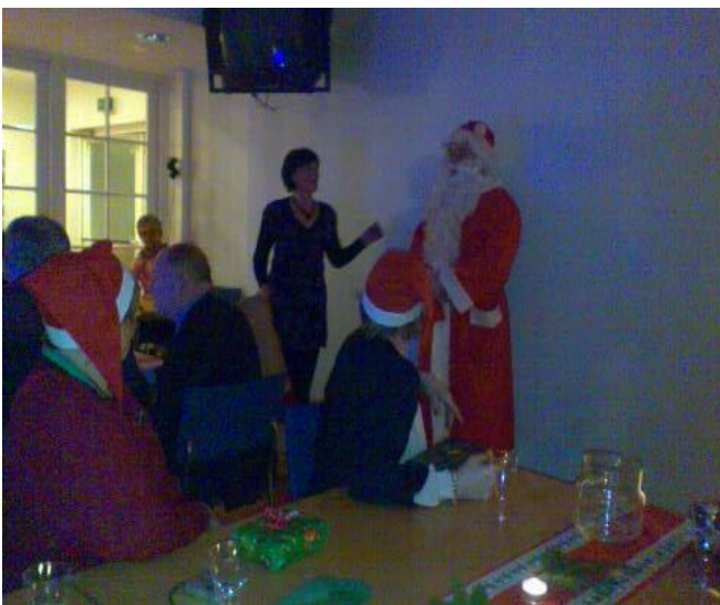
Joulupukki lahjoinensa juhlassamme