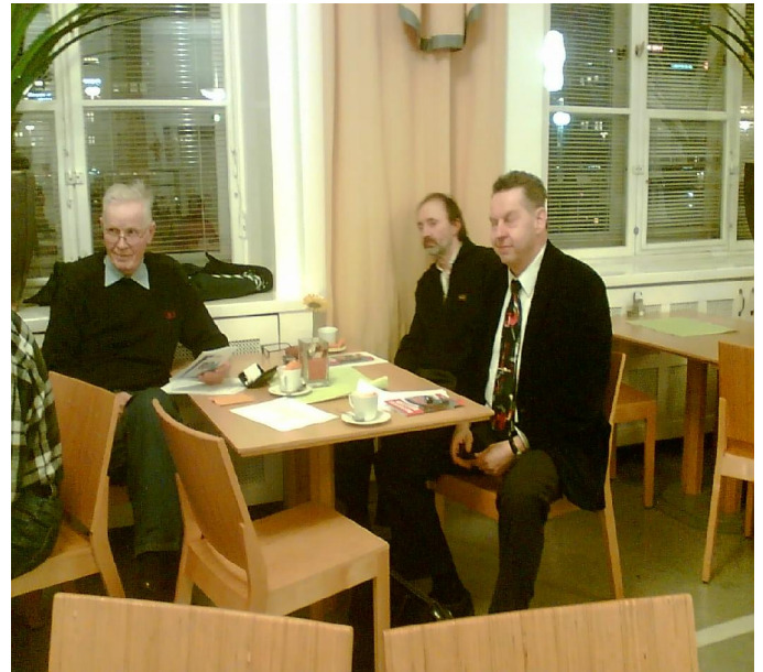
Kuva vuosikokouksesta 2008

Kokous pidettiin 12.3.2008 Henkilöstöravintola Höyrypannussa. Kokoukseen osallistui 50-60 jäsentä. Kokouksessa käsiteltiin sääntöjen vuosikokoukselle määräämät asiat. Mitään merkittäviä päätöksiä normaalista poiketen ei kokouksessa tehty. Jäsenmaksukin päätettiin pitää 10 €ssa.