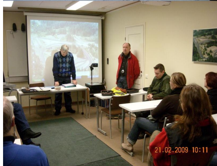
Kuvia liukaskeliharjoitustilaisuudesta Kulloosta