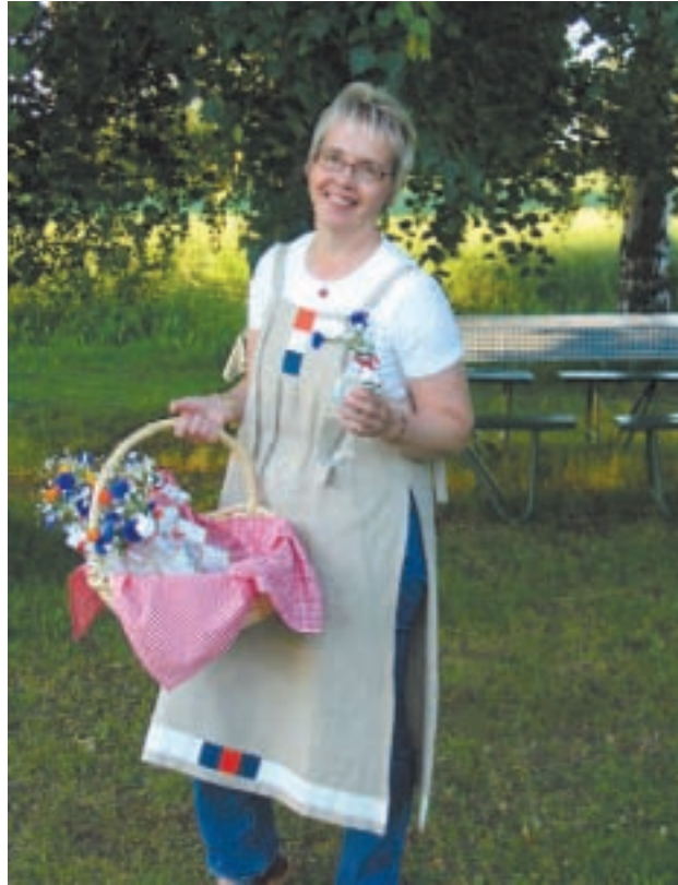
Kapsakan retkillä Kainuussa retkeläiset saavat muistoksi myös Lönnrotin Wesi –pullot

Tervan tie –retket ovat valmiiksi suunniteltuja päiväohjelmia yhdeksi tai useammaksi päiväksi ryhmällä käytettävissä olevan ajan ja erikoistoiveiden mukaan. Valittavina on mm. retki-