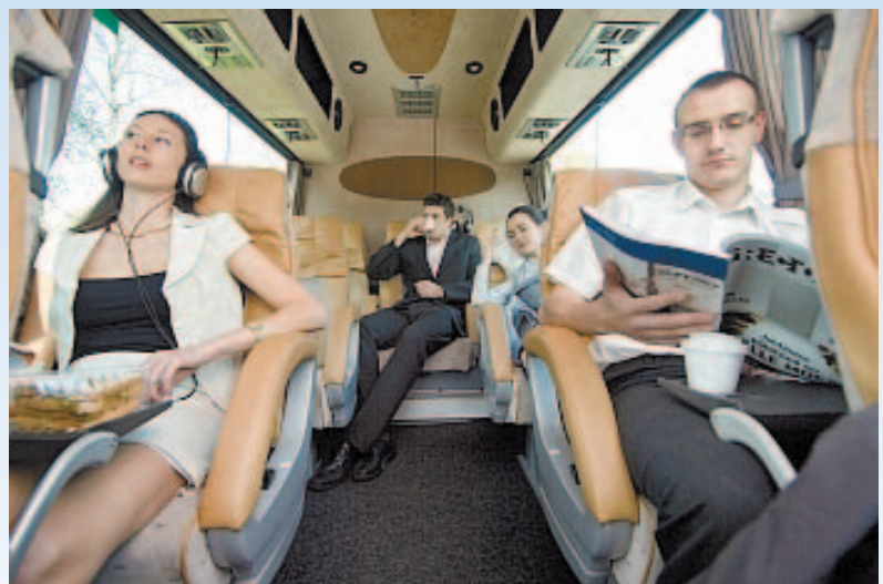
Lux Express minibussin sisätilat ovat avarat ja valoisat.

Teksti ja kuvat: Jorma Kuni ja Ari H. Heinonen