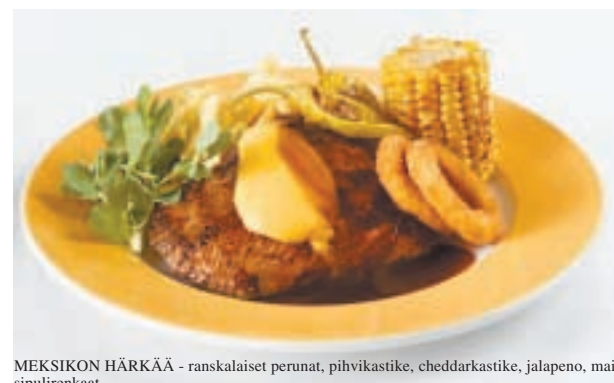
MEKSIKON HÄRKÄÄ - ranskalaiset perunat, pihvikastike, cheddarkastike, jalapeno, maissi, sipulirenkait