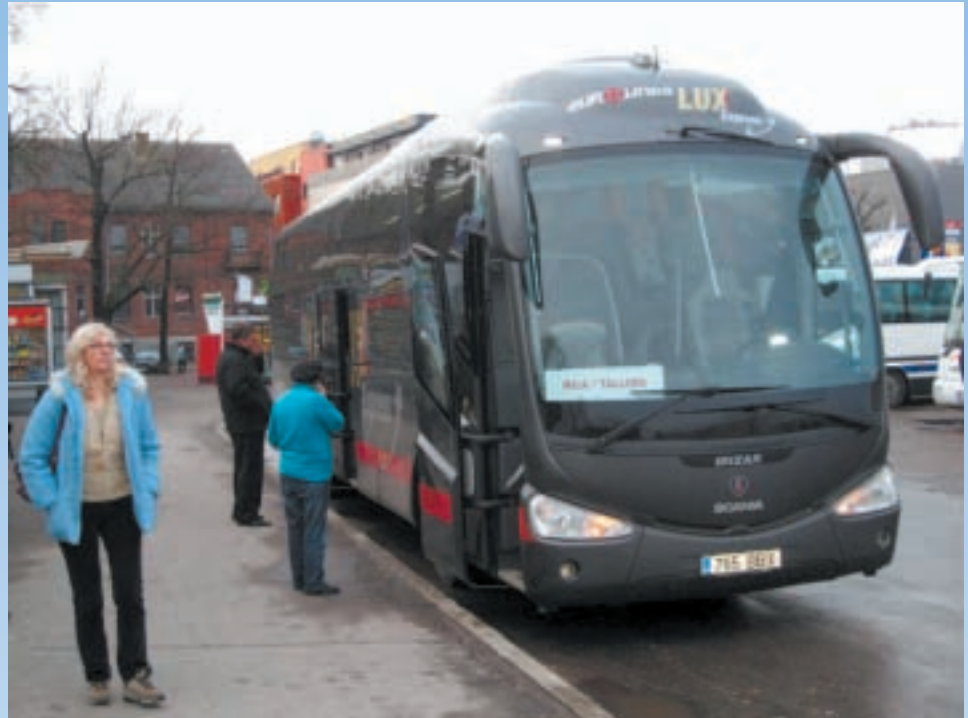
Lux Express bussi Pärnun bussiasemalla

Matkustaminen paikasta toiseen voi olla myös luksusta. Tämän ovat todenneet virolaisen Lux Express Grupp (entinen nimi Mootor Reisi AS/ Eurolines Baltic 1993 – 2010) kyydissä istuneet matkustajat. Yhä useampi matkalle lähtijä onkin noussut Mootor Grupp konsernin luksusbussein kyytiin matkustaessaan Baltian maissa tai Viron ja Venäjän välisillä linjoilla.