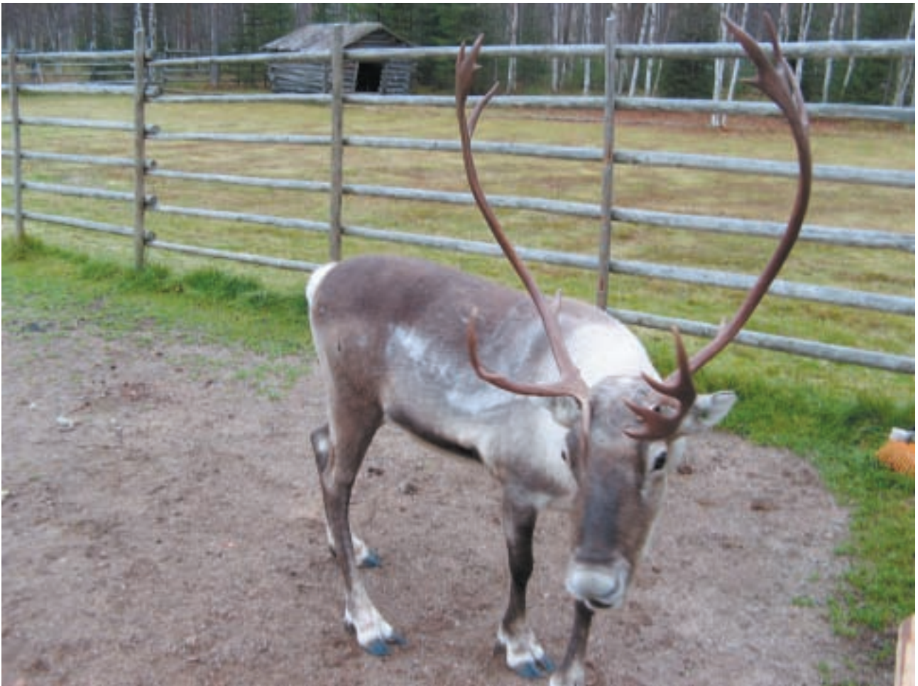
Porotilalla tutustuimme poromiestaitoihin. Tämä otus jätettiin rauhaan.