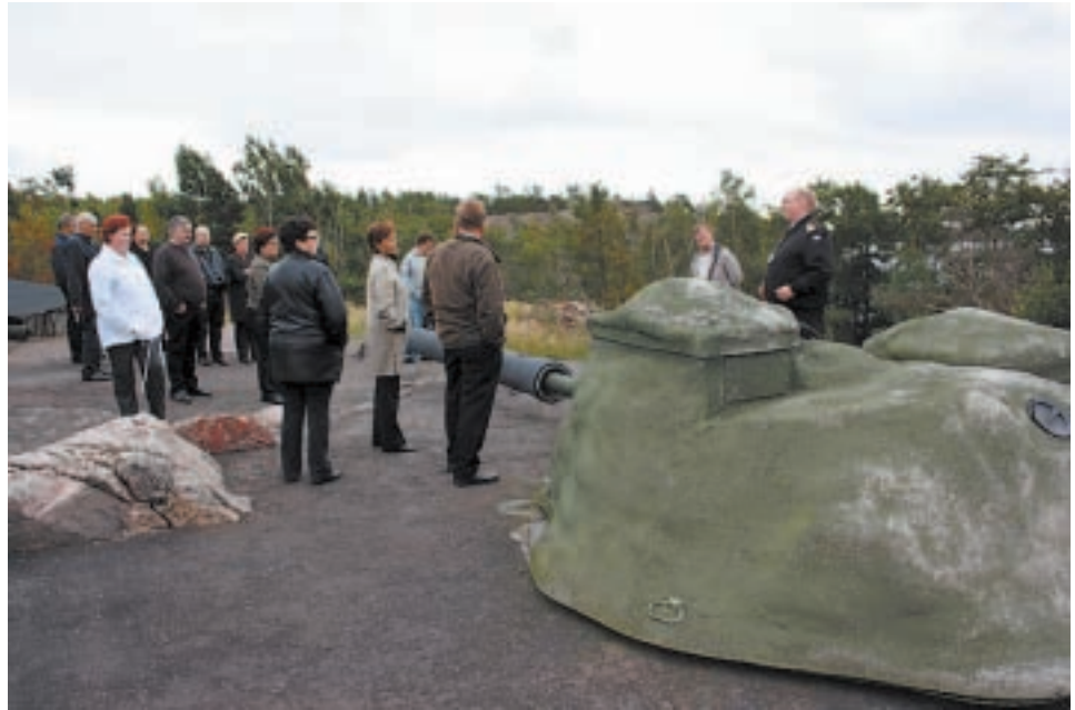
Tässä osa matkalle osallistujista tutustui järeään ”tykkiin”.

Pohjanmaan Tilausajokuljettajat ry:n syysretki suuntautui tänä syksynä pääkaupunkiseudulle. Lauantaina ohjelmassamme oli tutustuminen Upinniemen laivastotukikohtaan ja teatteriesitys Helsingin kaupunginteatterissa. Sunnuntain ohjelmaan oli varattu tutustuminen Helsingin kaupungin bussivarikkoon ja naisväelle oli varattu aikaa ostosten tekoon Helsingin kauppoihin, mutta vasta perillä huomasimme, että sunnuntaisin kaupat aukeavat vasta klo 12.00. Sen pulman ratkaisimme siirtämällä ostosten teon paluumatkalle Lempäälän Ideaparkkiin.