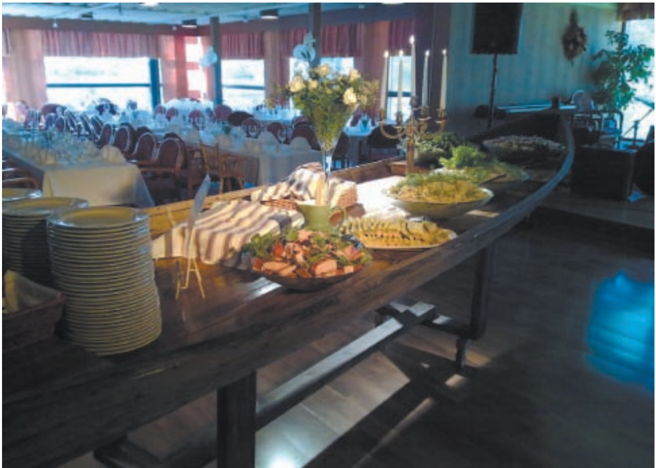
Ravintoloissa herkutellaan paikallisilla ruokaherkuilla ja maistellaan mm. tervasiirappia, tervasinappia, tervaleipää, tervakonvehteja, tervasnapseja.

Lisätietoja: www.tervantie.fi ja www.kapsakka.fi