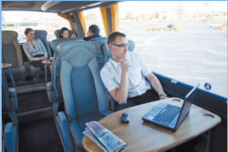
Lux Express-bussien langaton verkko tarjoaa hyvät työskentelymahdollisuudet matkan aikana.

Myös Viron sisäisessä liikenteessä kannustamme matkustajia hankkimaan liput internetin kautta. Tämä on ollut mahdollista meillä jo kymmenen vuoden ajan. Nykyisin bussin päällä käsitellään rahaa varsin vähän