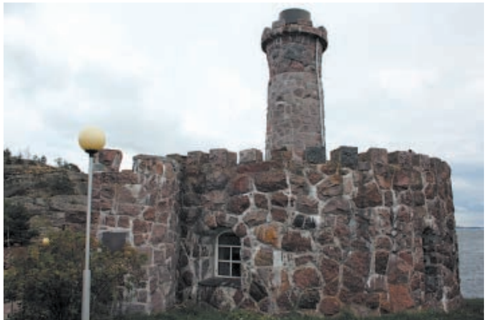
Upinniemessä oli myös näin "kivikova" Kajanuksen sauna.