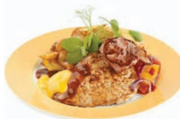
KEITTIÖMESTARIN POSSUA - pekoni, maustetut lohkoperunat, cheddarkastike, pihvikastike, hedelmäsalsa (G)