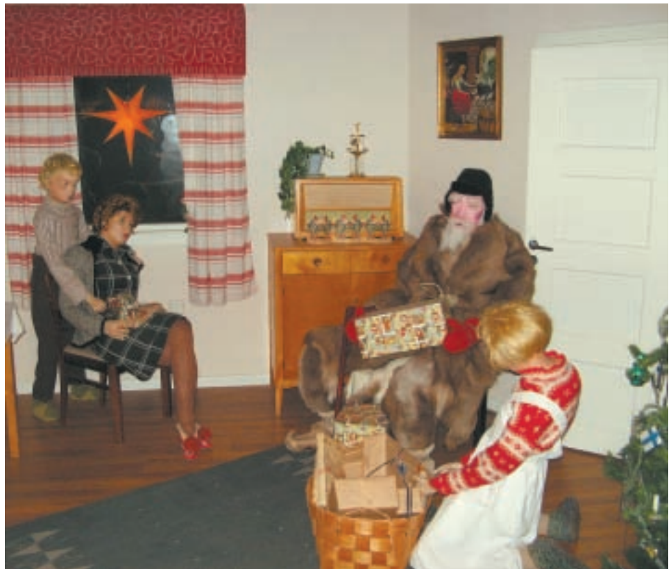
Joulutalon näyttelyssä voi tutustua Joulunvieton historiaan ja tapoihin ympäri maailman.