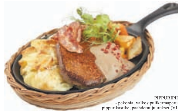
PIPPURIPIHVI - pekonia, valkosipulikermaperunat, pippurikastike, paahdetut juurekset (VL,G)