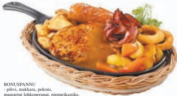
BONUSPANNU - pihvi, makkara, pekoni, maustetut lohkoperunat, pippurikastike, sipulirenkaita, paahdetut juurekset (VL)

Raaka-aineissa on lisätty gluteenittomien tuotteiden määrää, siemeniä ja maissintähkiä. Osa liikennemyymälöistä tarjoaa myös suosittuja uuniperunoita. Kastikkeista kermainen pippurikastike on jalostunut, uusia ovat roqueford-, luumu- ja metsäsienikastikkeet ja lihapullat ovat saaneet kokoa lisää lähes kaksinkertaisesti. Useimmissa ABC Restauraanteissa valikoimiin kuuluu nyt myös useampia kasvisvaihtoja esimerkiksi kasvispihvi ja rösti sekä rouheinen kasvisburger uusituilla täytteillä.