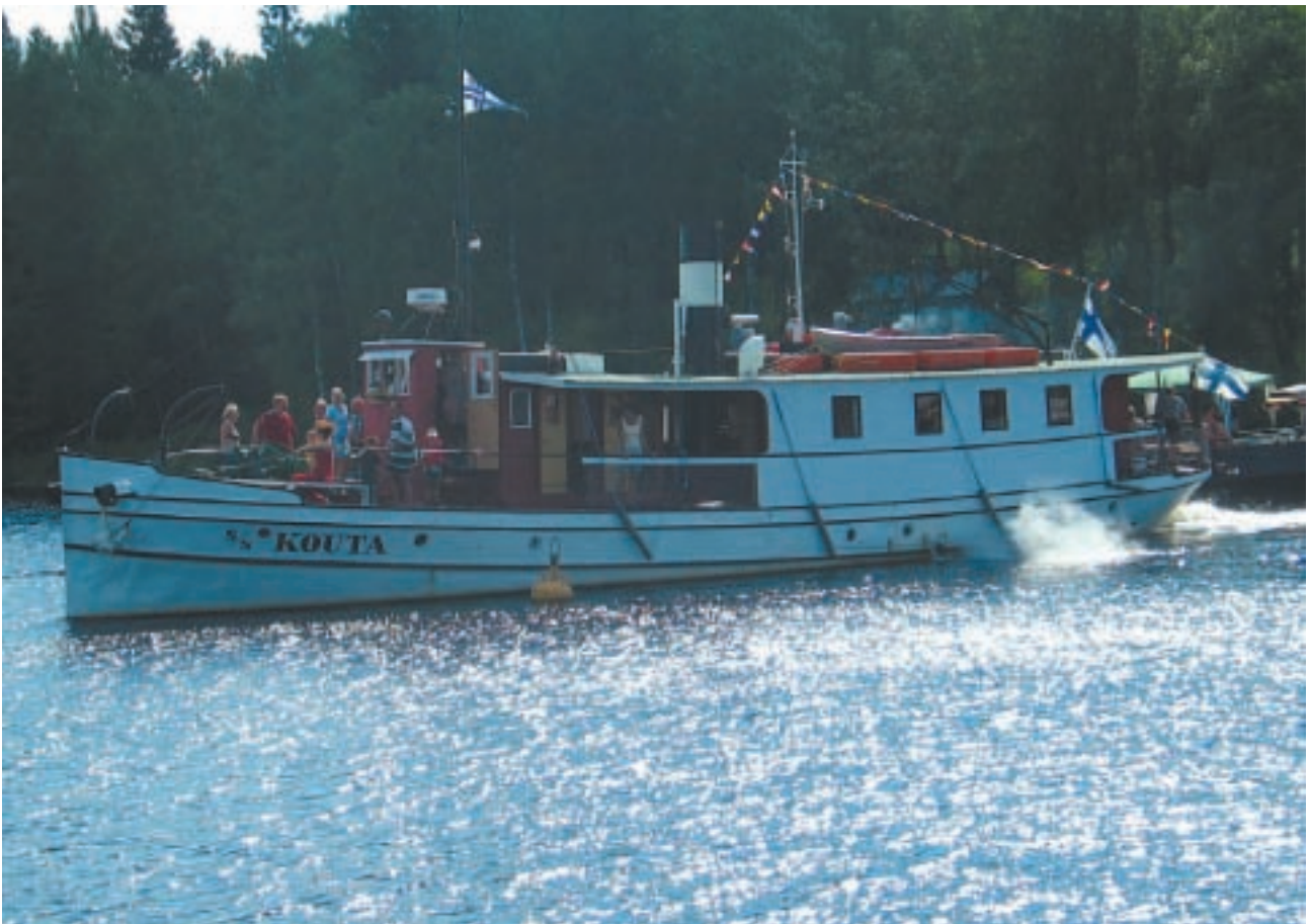
Suomen pohjoisin matkustajaliikenteeseen katsastettu S/S Kouta risteilee Oulujärvellä maisemissa, joissa aikoinaan tervaa soudettiin ja merirosvoustakin harjoitettiin.

Retkeläiset pääsevät osallistumaan tapahtumiin ja tilaisuuksiin, joissa terva-aikojen tunnelma on koettavissa vielä tänäkin päivänä. Kesäisin tervahautoja poltetaan näytösluonteisesti eri puolella aluetta ja Kajaanissa maailman ainoalla toimivalla tervakanavalla järjestetään ainutlaatuisia tervansoutunäytöksiä. Oulujoen vesistön vanhoilla tervansoutureiteillä järjestetään useita soutu tapahtumia ja tulevana kesänä myös isommatkin bussiryhmät voivat jälleen nauttia Oulujärven upeista maisemista ja entisajan höyrylaivatunnel-