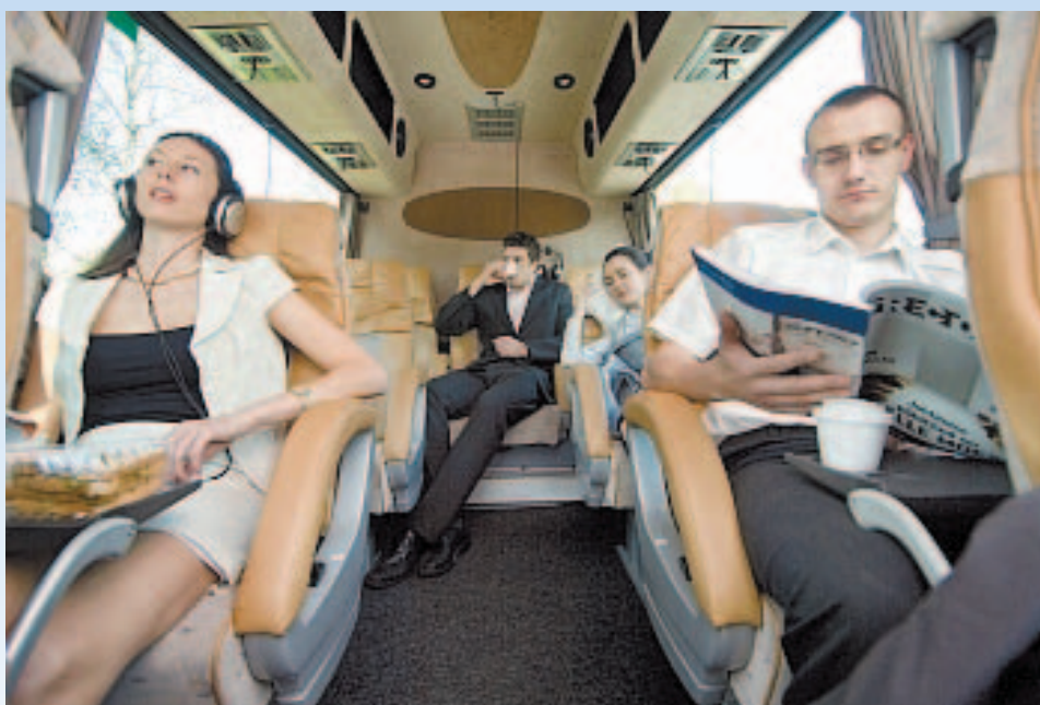
Mercedes Sprinter-väikebussis istub kümme reisijat.

Tekst ja pildid: Jorma Kuni ja Ari H. Heinonen Tõlkinud: Vahur Lihtkivi