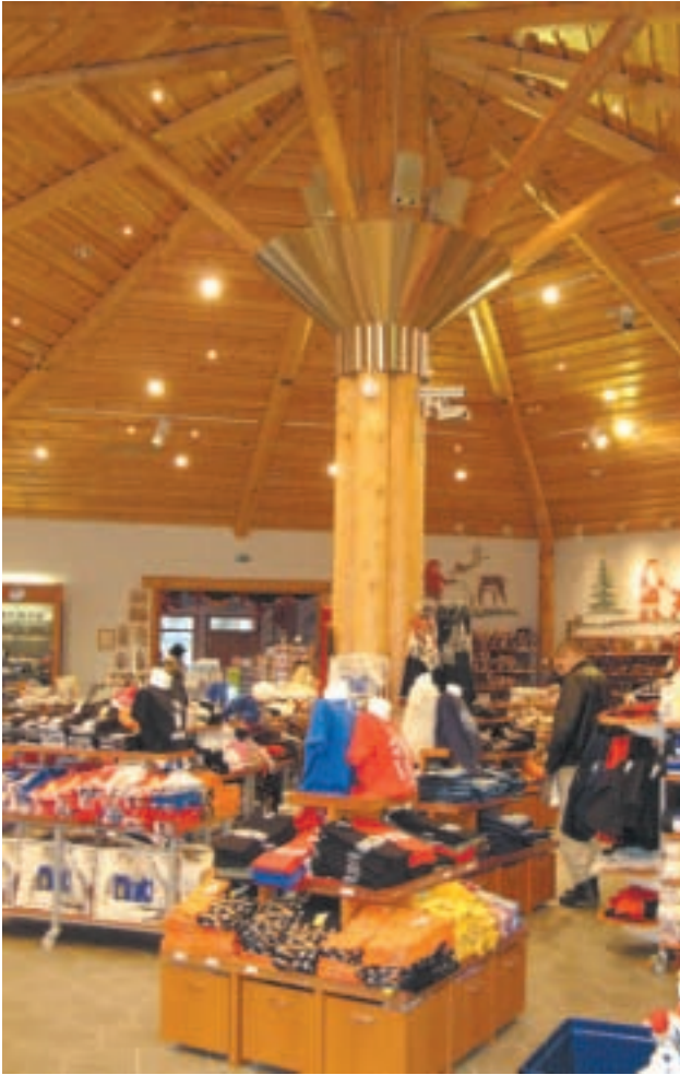
Napapiirin Lahja ja Joulutalo tarjoaa matkamuis-toja joka lähtöön.