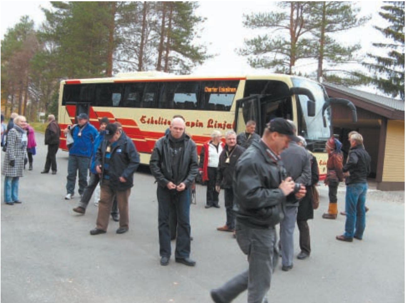
Linja-autokyyti Eskelisellä kuului ohjelmaan.

jossa testattiin jäsenten porromiestaitoja ja jokainen sai perinteisen lapinkasteen. Pienen ulkoilun päätteeksi nautimme porokeittolounaan, hieman pitemmän kaavan mukaan.