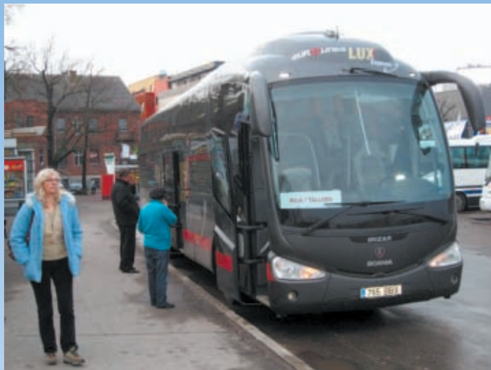
Lux Express-buss Pärnu bussijaamas.

-Sihikindel investeerimine reisimise kvaliteeti, bussidesse kui ka teenindusse on kasvatanud aasta aastalt