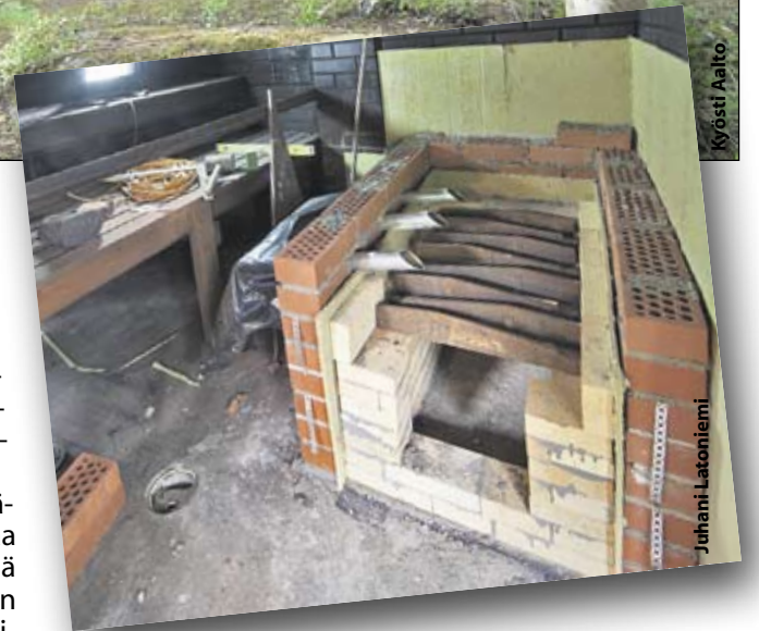
Kiukaan seinämän läpi on asennettu kolme putkea, jotka johtavat palamiseen tarvittavaa lisäilmaa.

Savusaunan lämmittäminen on tarkkaa ja aikaa vievää puuhaa. Lämpiävää sauna ei voi jättää oman onnensa nojaan. Palamisen aikana ja varsinkin sen jälkeen saunan tuuletuksesta on huolehdittava kunnolla.