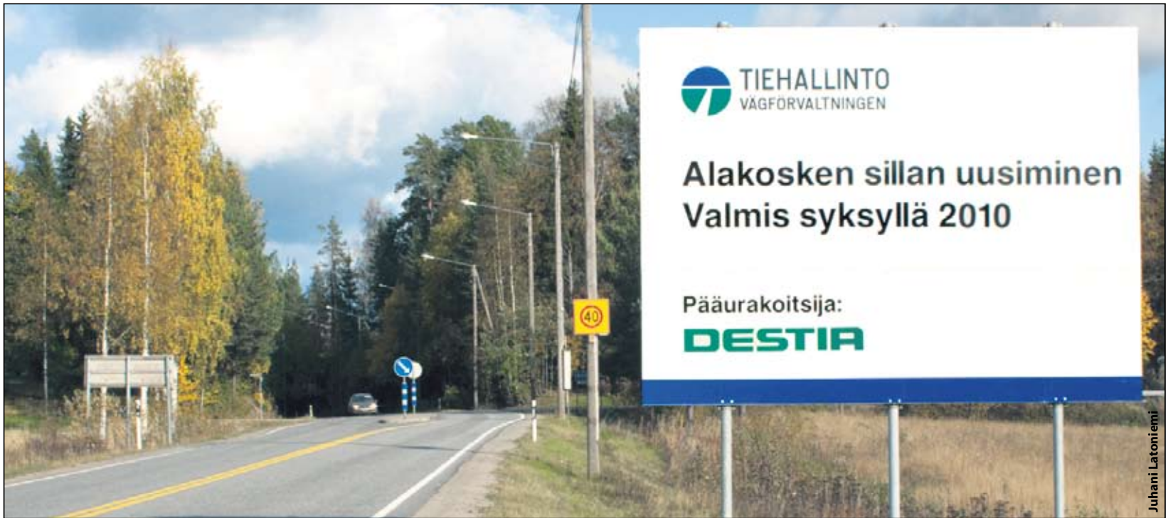
Ruovedentien varrelle ilmestyi odotetun siltatyömaan taulut.

- Järjestelyjen takia liikenne katkeilee joten toivomme kulkijoilta kärsivällisyyttä. Erityistä varovaisuutta tulee noudattaa ja huomioida työmaalla hitaasti liikkuvat koneet, tähdentää Nissinen. Uusi silta avataan liikenteelle suunnitelman mukaan noin vuoden kuluttua.