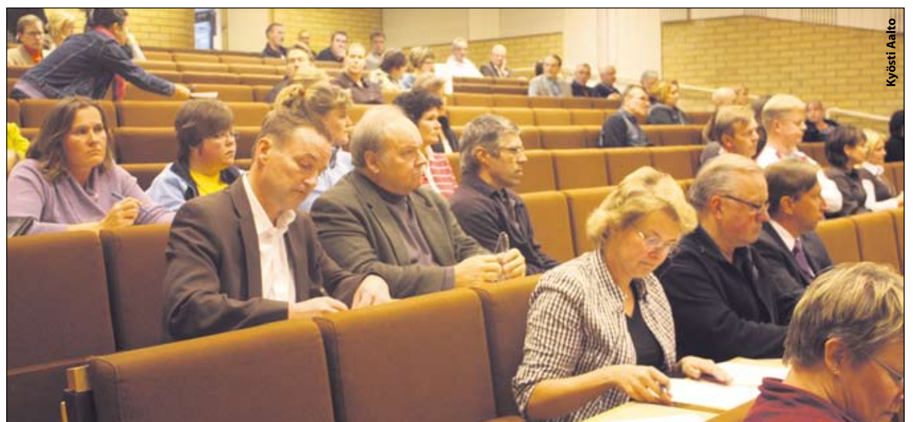
Huolestuneita kaupunkilaisia kokoontui Ylöjärven lukion auditorioon.