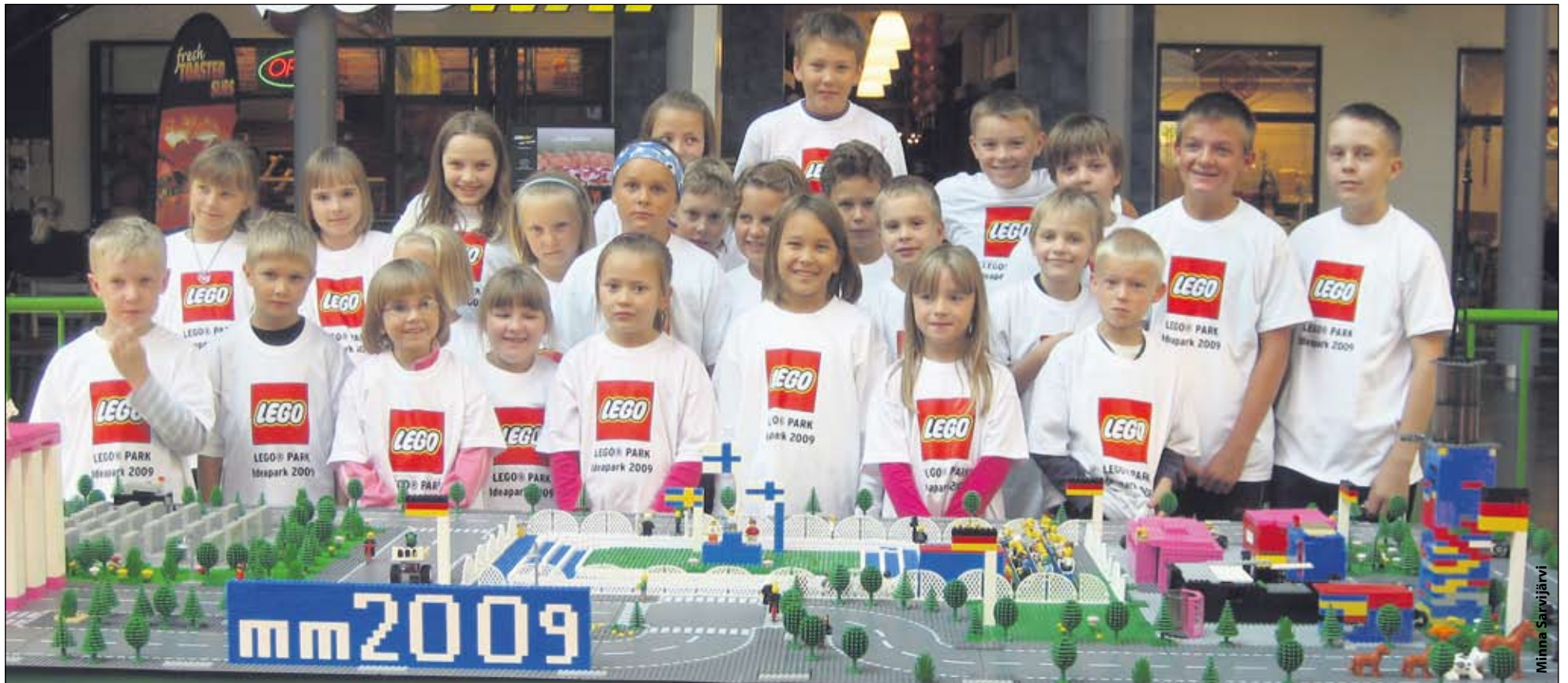
Parkkuun koulun voittoisa joukkue Lego-Berliinin takana.