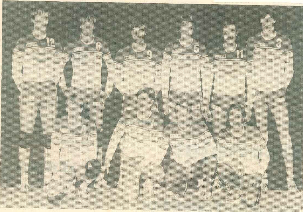
Seinäjoen Maila-Jussien lentopallon miesjoukkue varmisti sen, että palloilumalja tuli Maila-Jusseille.

Palloilumaljan pisteet: 1) Seinäjoen Maila-Jussit 66 pist. 2) Nurmon Jymy 64,5 3) Kauhajoen Karhu 64 4) Vähänkyrön Viesti 60 5) Lapuan Virkiä 55 6) Kurikan Ryhti 52,5 7) Alahärmän Kisa 43,5 8) Alavuden Ns:n Urheilijat 43 9) Vaasan Vasama 43 10) Kauhavan Visa 42 11) Kyrön Voima 41 12) Ylihärmän Junkkarit 39 13) Laihian Liitto-Urheilijat 38 14) Peräseinäjoen Toive 35 15) Alajärven Ankkurit 34,5 16) Teuvan Rivakka 33,5 17) Koskenkorvan Urheilijat 33, Yliastaron Ns:n Urheilijat 33 19) Ahtärin Mesikämmen 31 20) Jalsjärven Jalas 29,5 21) Mietaan NS:n urheilijat 28,5 22) Kristiinan Urheilijat 26 23) Vimpelin Veto 24,5 24) Vaasan Maila 23,5, Lappajärven Veikot 23,5 26) Soinin Tiikerit 22,5 27) Ilmajoen Kisailijat 22 28) Evijärven Urheilijat 20 29) Seinäjoen Urheilu-Miehet 19 30) Kuortaneen Kunto 18, Nopankylän Kisa-Veikot 18 32) Ilkan Pallo 17 33) Jurvan Urheilijat 16 34) Vaasan Sport 15, Isojoen Urheilijat 15 36) Kurikka-Pesis 13, S-Kiekko 13, Kauhavan Lentopallo -77 13 39) Ahtärin Kiekko-Haukat 11,5,