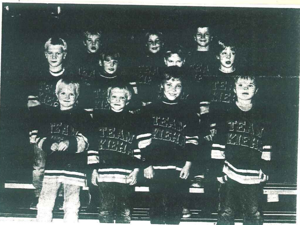
F-JUNNUT (-73 synt. ja nuoremmat)