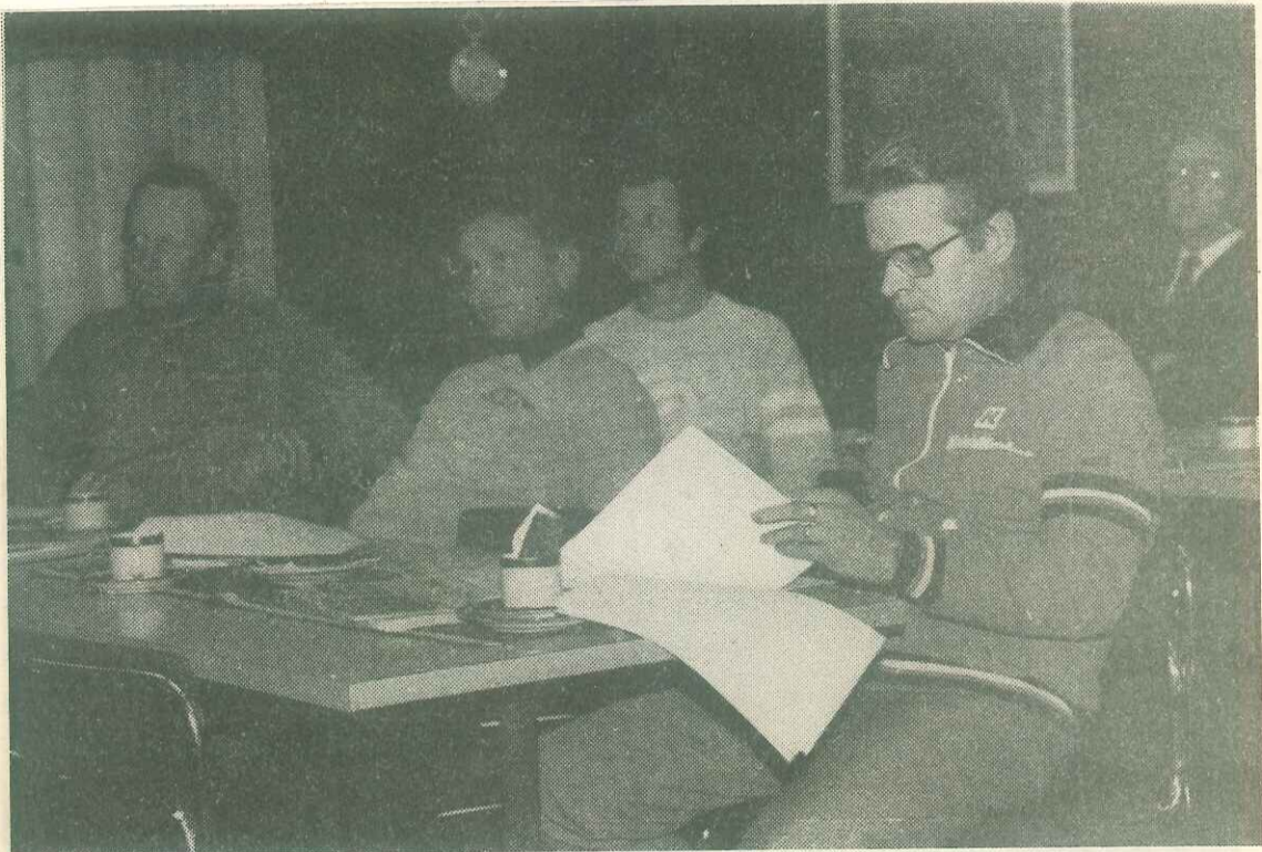
SVUL:n E-P:n piirin ähtäriläisten jäsenseurojen edustajat saivat viime viikolla etukäteistietoa tulevasta piirin 75-vuotisjuhluvuodesta.